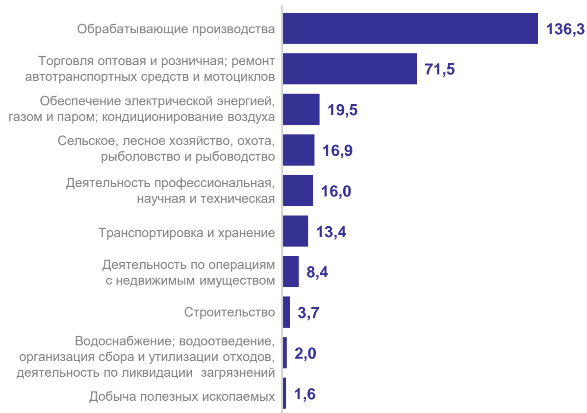
Прибыль организаций по отдельным видам экономической деятельности, млрд руб.