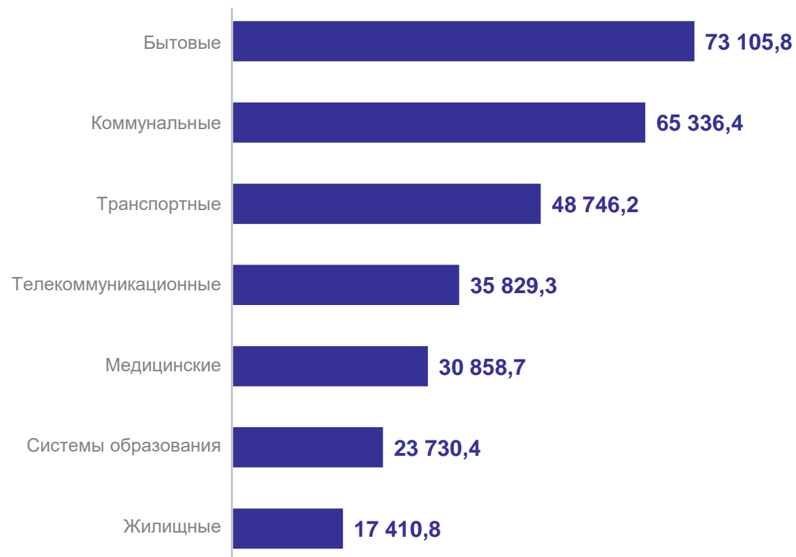
По отдельным видам услуг, млн рублей